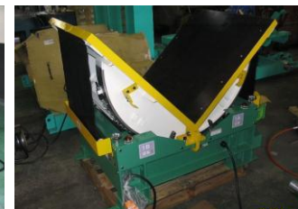
反転機 1t用 フル装備特大型 BTM-1 H-101