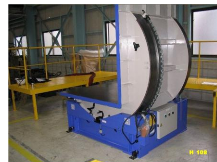
反転機 10t用 BTM-10E 標準型 H-108