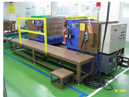
金型開閉機 2t用 BOP-2A K-103