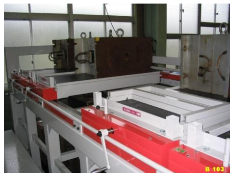
BX機 ハンドル式 5~8t用 2段 9種 BX2-5SD-9H(2) B-103