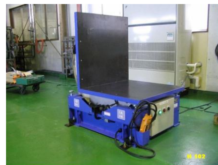
反転機 1t用 標準型 BTM-1E B-102