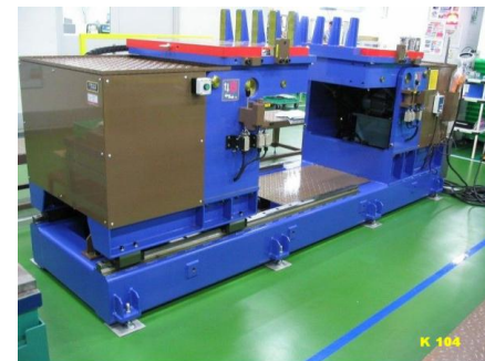
金型開閉機 2t用 72"φ×1550"付 BOP-2A K-104