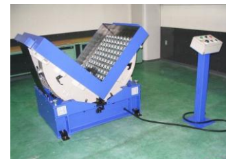
反転機 5t用 BTM-5 フル装備 M-100