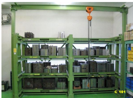
フルスライド棚 クレーン付 2t用 4段 8種 PWR-8H(2) C-101