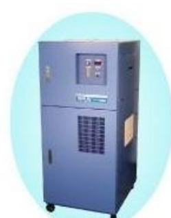
窒素ガス発生装置 (PSA方式)