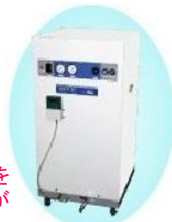
窒素ガス発生装置 (分離膜方式)